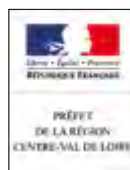
MEDDAH Nacer Préfet de la région Centre-Val de Loire, Préfet du Loiret