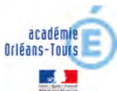
BEGUIN Katia Rectrice de l'Académie d'Orléans-Tours