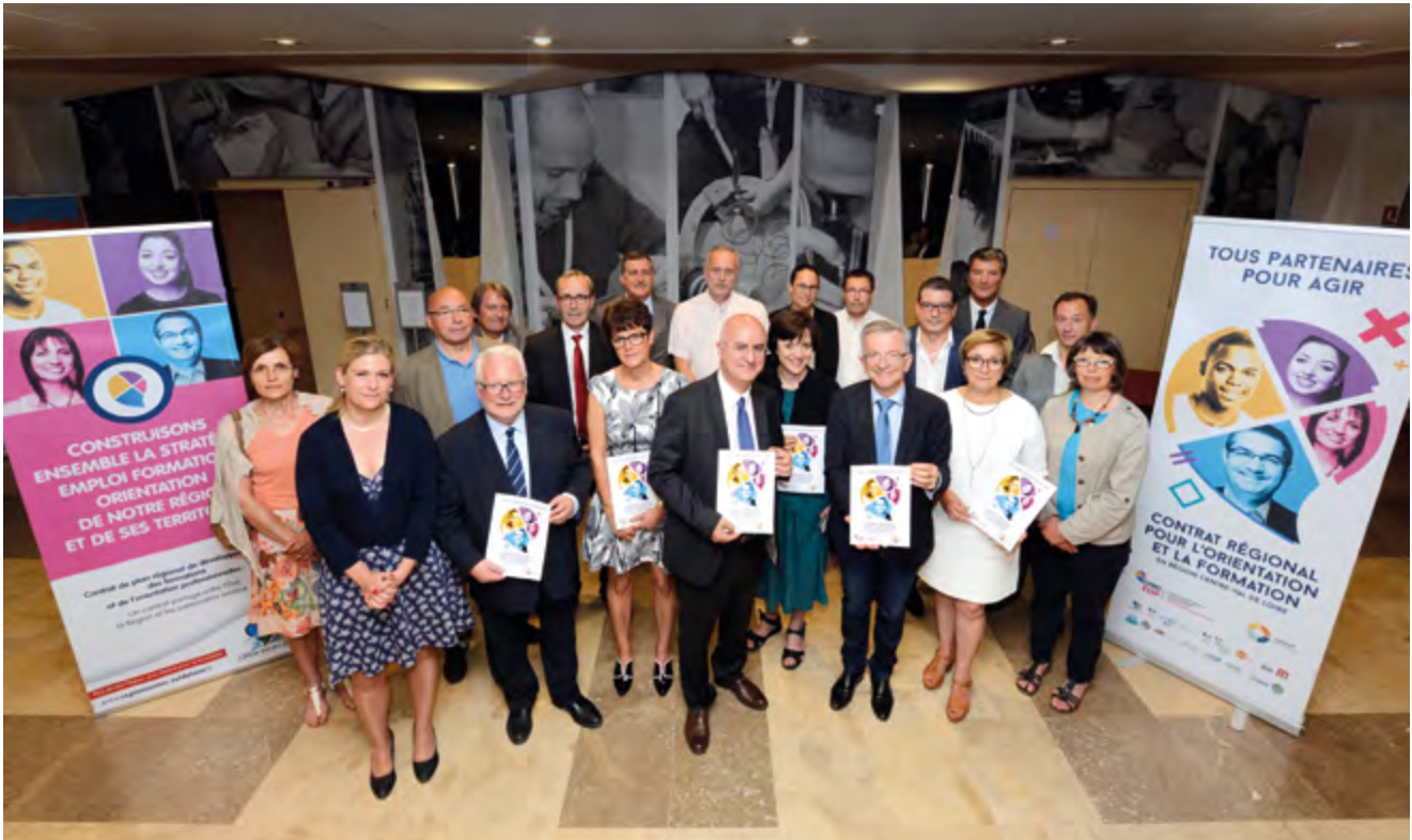
Les signataires du Contrat de Plan Régional de Développement des Formations et de l'Orientation Professionnelles.